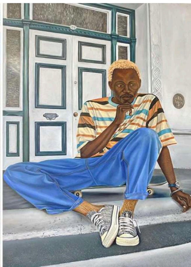
Ukhona umnyango ovuliweyo (When one door shuts another one opens), 2022