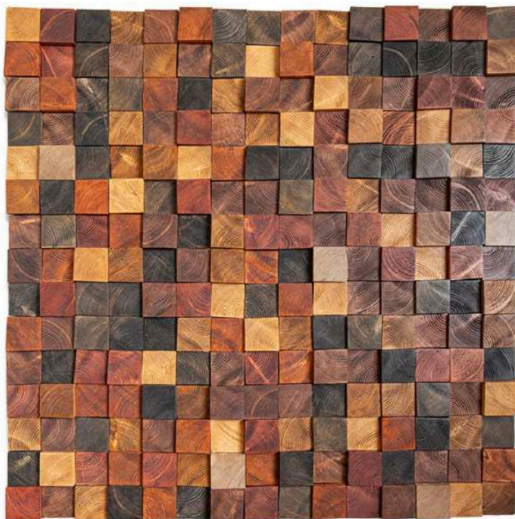
Google Noir, 2020