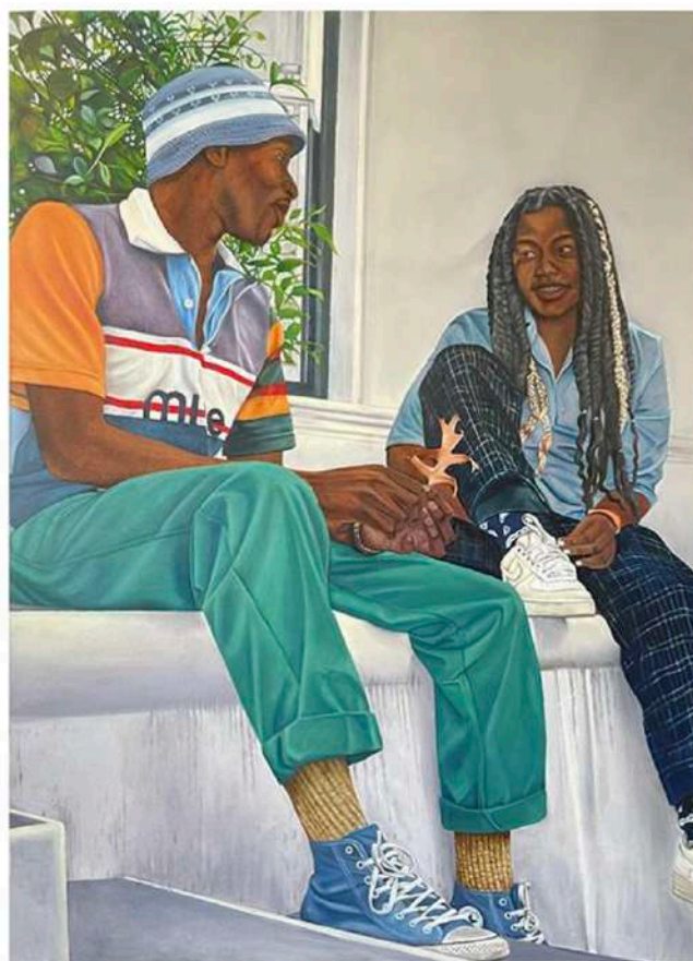
Ulungazenzisiyo (Anyone can love a rose, but it takes a lot to love a leaf), 2022