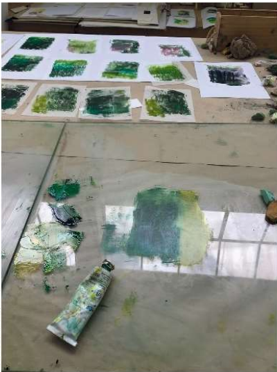
Galerie Charles-Wesley Houndoupp Paris 2021