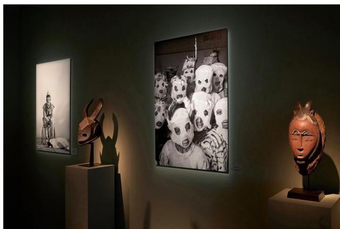
Экспозиция стенда галереи Charles-Wesley Hourdé с фотографиями Фатуматы Диабате.

Тематическая экспозиция, посвященная дикому, первозданному миру природы Западной Африки Wild Spirits , на стенде галереи Charles-Wesley Hourdé была представлена в диалоге с работами современного фотографа Фатуматы Диабате (Fatoumata Diabaté), демонстрирующими долговечность культурного наследия малийского общества. Группа зооморфных масок-шлемов в виде птиц, обезьян, буйволов и леопардов имеет ту же символику, что и работы фотографа, созданные столетием позже.