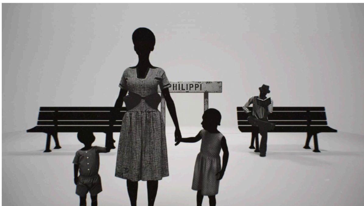
« Shadows of Re-Memory », Film Still 1, 2021, image issue de l'exposition « Haufi nyana? I've come to take you home » de l'artiste et photographe sud-africaine Lebohang Kganye au FOAM Photography Museum à Amsterdam, aux Pays-Bas. © Lebohang Kganye

Du 24 mars au 2 avril, le grand festival documentaire Cinéma du réel ouvre ses portes au Centre Pompidou-Paris. Parmi les 1 600 films inscrits, 41 documentaires ont été sélectionnés en compétition, dont la première mondiale de Coconut Head Generation (France-Nigeria), d'Alain Kassanda.