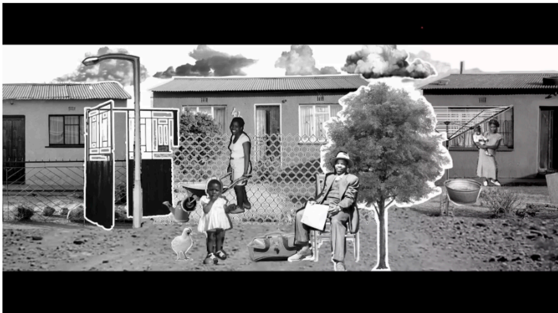
« Mohlokamedi wa Tora » Scene 2 (2018), image issue de l'exposition « Haufi nyana? I've come to take you home » de l'artiste et photographe sud-africaine Lebohang Kganye au FOAM Photography Museum à Amsterdam, aux Pays-Bas. © Lebohang Kganye.

Quel accès aux archives concernant le passé colonial ? Une rencontre-débat dédiée à ce sujet sensible est organisée le 4 mars par l'Association histoire coloniale et postcoloniale à Paris. Parmi les événements historiques abordés où les chercheurs sont confrontés au « Secret défense » se trouvent « L'affaire Curiel », « L'affaire Ben Barka », « L'affaire du juge Borrel » ou « La France lors du génocide au Rwanda ».