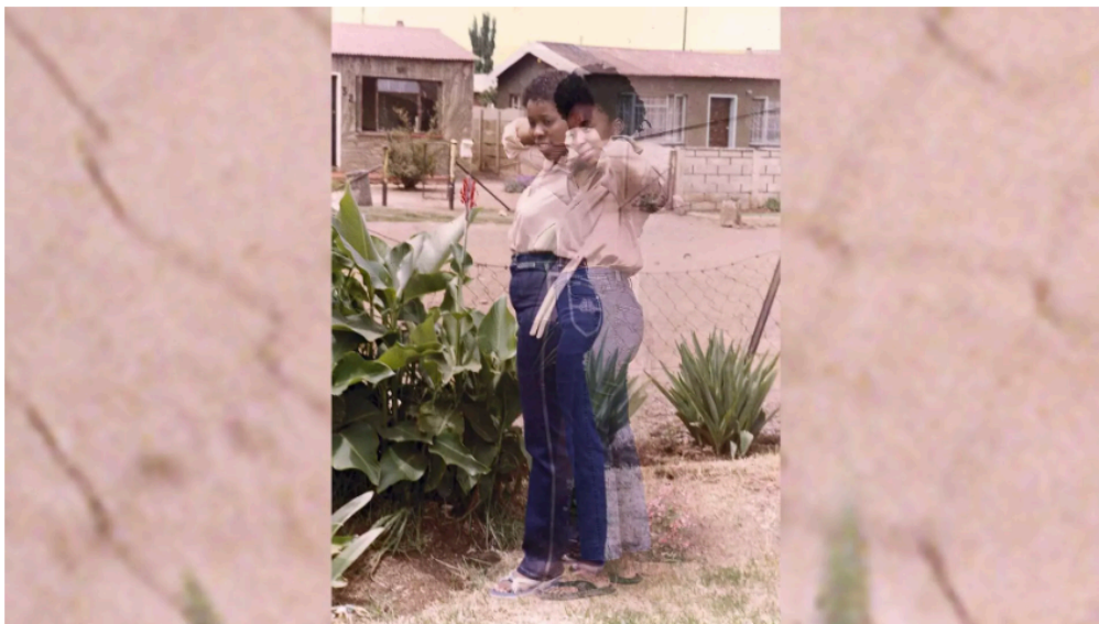
« Habo Patience ka bokhathe II » from « Ke Lefa Laka: Her-Story » (2013), image issue de l'exposition « Haufi nyana? I've come to take you home » de l'artiste et photographe sud-africaine Lebohang Kganye au FOAM Photography Museum à Amsterdam, aux Pays-Bas.

Le Yemisi Shyllon Museum of Art à Lagos présente jusqu'au 31 mai l'exposition Water Under the Bridge: An Exploration of Migration and Memory . Cette exploration de la migration et de la mémoire donne le ton à des vies qui ont été forcées à un exode moderne, mais aussi aux rêves nigériens et la fuite massive des cerveaux.