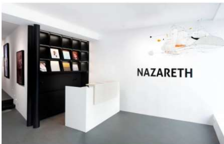
Vue de l'entrée de l'exposition « Nazareth » à la Galerie By Lara Sedbon, Paris ⓘ