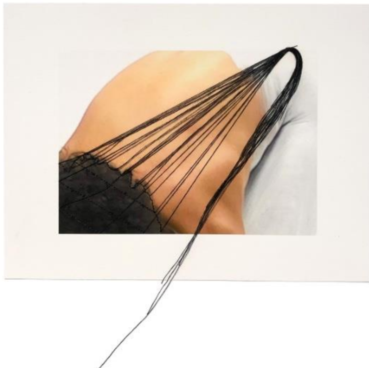
M'barka Amor, 2020, Now I'm White / Prolongement , tissage de fil de soie, impression numérique sur papier rag fine art, 15 x 20 cm.